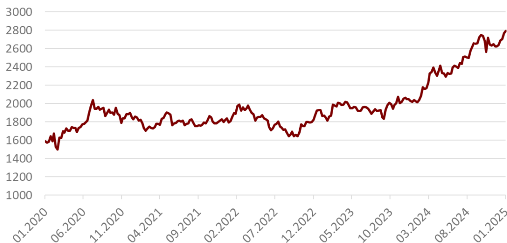
1 – Goldpreis (in USD, 5 Jahre)

Sehr erfreulich - dank unserer hohen Beimischung - wirkte sich der Goldpreis aus. Mit einem Plus von rund 7 % seit Anfang Jänner und einem Zuwachs von 40 % seit einem Jahr konnte das Edelmetall erneut glänzen (siehe Grafik 1).